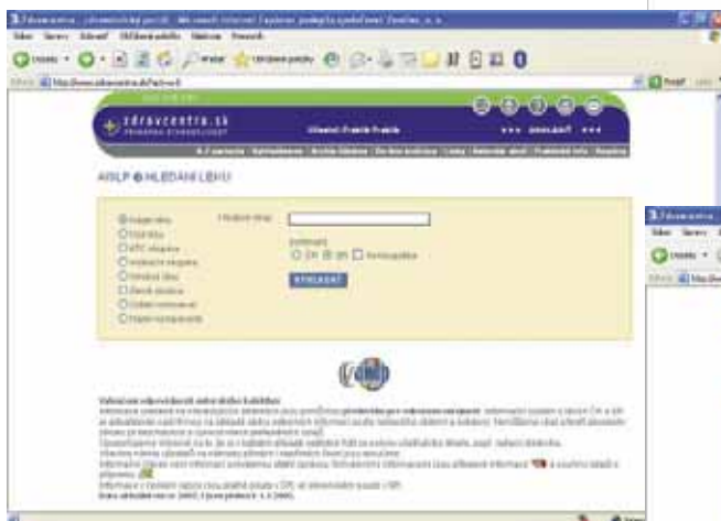
Databáza liekov – AISLP