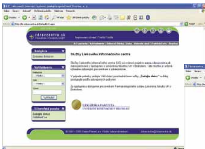
Liekové informačné centrum